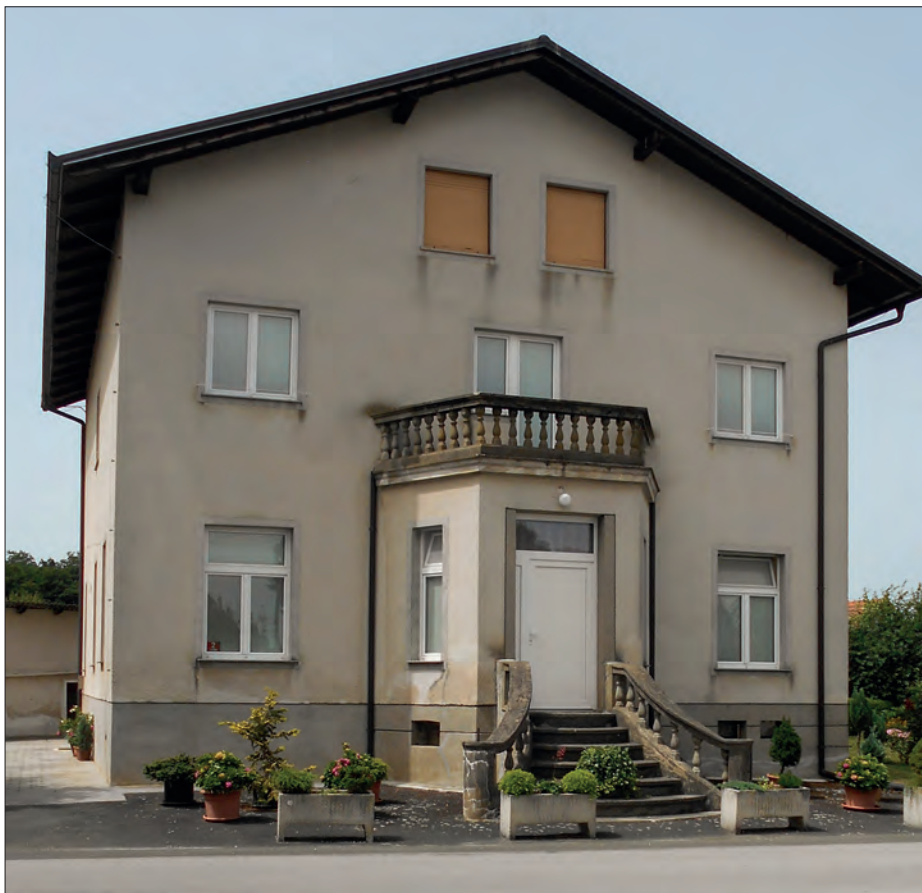
Nadgrajena hiša, v kateri je poslovala zadružna posojilnica in hranilnica na Cvenu.

Načelstvo zadruga je bilo sestavljeno iz načelnika, njegovega namestnika in petih članov načelstva. Pravico zastopati zadrugo je imelo načelstvo, ki se je podpisovalo v imenu zadruga tako, da sta ga lahko dva člana načelstva podpisovala v imenu zadruga, svoje ime pa podpisala pod firmo, ki je lahko bila napisana ali s pečatnikom odtisnjena.