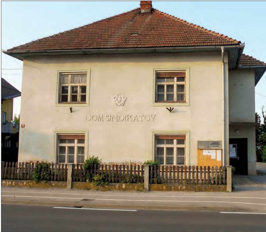
Nekdanji Viničarski dom na Ormoški cesti v Ljutomeru, kjer je od leta 1940 poslovala tudi viničarska kreditna zadruga (danes Društvo upokojencev Ljutomer).