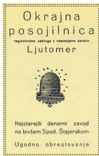
Reklamni oglas Okrajne posojilnice v Ljutomeru.

Tudi iz popisa prebivalstva za leto 1880 je razvidno, da je bilo v trgu Ljutomeru 608 Slovencev in 468 Nemcev. 10 Popis je bil izveden po metodologiji občevalnega jezika, ki je bil v mestih in tudi v trgih na slovenskem Štajerskem v nemško korist, ne pa na osnovi narodne pripadnosti, kar je bilo nedvomno v škodo Slovencev in ni kazalo realne slike prebivalstva (op. a.). Po drugi strani pa zasledimo v slovenskem časopisju od ljutomerskih poročevalcev, da naj bi bila v Ljutomeru v času nastanka čitalnice, 1. slovenskega tabora in kasneje posojilnice le peščica pravih Nemcev, ostali naj bi bili po sili Nemci oziroma nemškutarji. 11