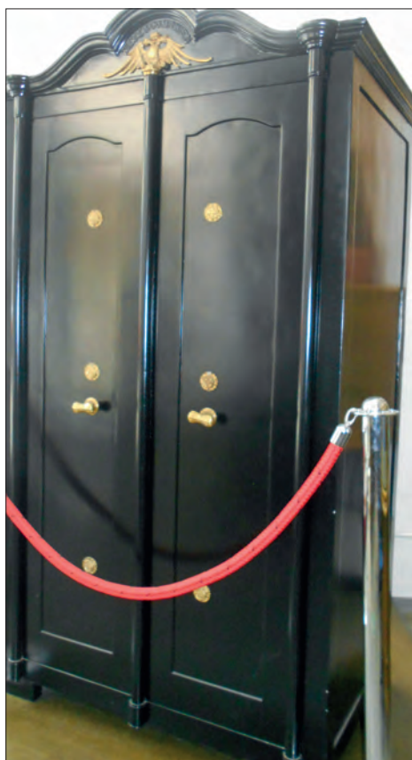
Trezor Okrajne posojilnice v Ljutomeru, izdelan konec 19. stoletja.

Član posojilnice je lahko postal, kdor je imel pravico sklepati pogodbe, podpisal pravila in vplačal določeno članarino. Kdor se ni ravnal v skladu s pravili, je bil lahko na predlog načelstva izključen, to pa je moral potrditi občni zbor. Kdor je hotel izstopiti, je moral najmanj tri mesece vnaprej vložiti izstopno izjavo, da mu je bil izplačan njegov delež z obrestmi, ni pa imel pravice do dobička posojilnice. Varčevalci so bili z deleži vezani na vse društvene dejavnosti v primeru stečaja ali likvidacije posojilnice, v kolikor premoženje ne