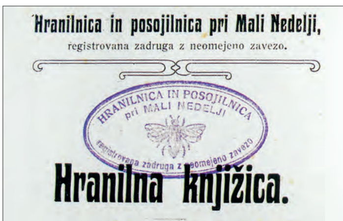
Naslovna stran hranilne knjižice Hranilnice in posojilnice pri Mali Nedelji, 1917 (Last: Ludvik Rudolf, M. Nedelja).

Zadruga je temeljila na novih pravilih, po Zakonu o gospodarskih zadrugah z 11. septembra 1937 sprejetih na skupščini zadruga 7. maja 1939.