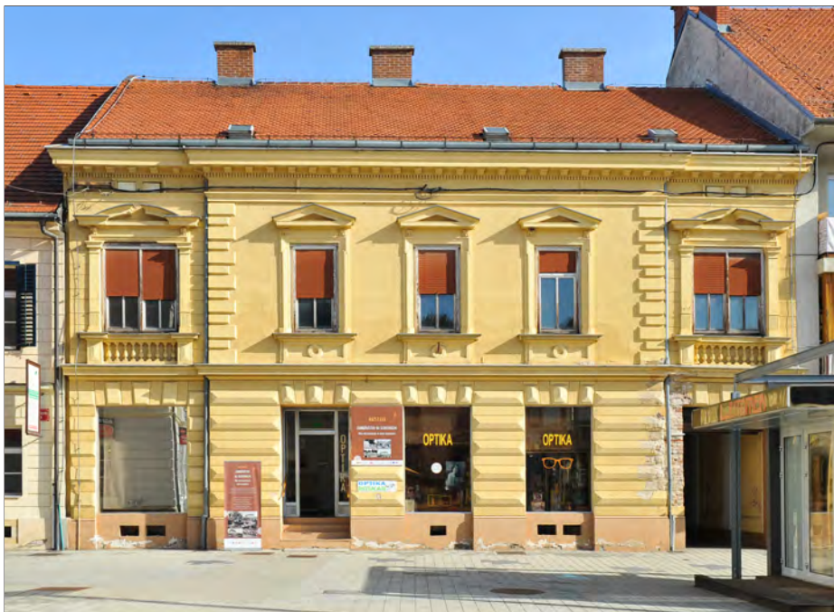
Stavba nekdanje Okrajne posojilnice v Ljutomeru, zgrajena leta 1897.

Ob 25-letnici poslovanja, leta 1897, je imela posojilnica 280.966 gld prometa in 2.601 gld dobička, rezervni sklad posojilnice je znašal 30.000 gld. Novo zgrajena stavba posojilnice v Ljutomeru (danes Glavni trg 13), v kateri je pričela poslovati leta 1897, je bila z zemljiščem ocenjena na 21.000 gld. 17