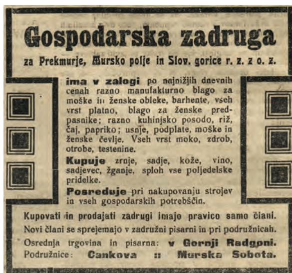
Slika 1: Reklama v Murski straži, 18. 10. 1919

O novoustanovljeni zadrugi so v časniku zapisali, da je bila udeležba nepričakovano velika, kar dokazuje, da je takšna zadruga bila za mursko okrožje res potrebna in da se je ljudstvo zavedalo njene pomembnosti. Časnik v vseh naslednjih številkah vabi vse zainteresirane, da se pridružijo zadrugi, tako so na primer v sredini meseca junija nagovarjali, da se bo vršil sprejem novih članov za občine Ščavnica in Plitvički vrh. Kot so predstavili: » Gospodarska zadruga je ravno nasprotna velikim vojnim dobičkarjem, ki so med vojsko odirali ljudi in skrivali blago. Proti malim in poštenim trgovcem zadruga ne bo delovala. « 16