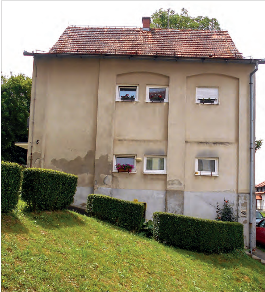
Stavba, v kateri je poslovala posojilnica pri M. Nedelji od leta 1924.